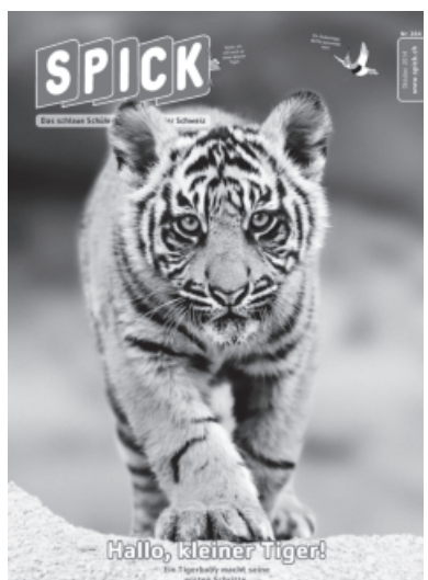
Die Jugendzeitschrift Spick wird ausschliesslich über den Abonnementspreis finanziert.

Die Ertragsstruktur eines Verlags ist ausserordentlich variabel und wesentlich vom Typ der Zeitung oder Zeitschrift mitbestimmt. Als Extremfälle gibt es Zeitschriften ohne jegliche Werbung (z. B. Kinderzeitschriften, wissenschaftliche Zeitschriften). Auf der anderen Seite gibt es aber auch Publikationen (wie zum Beispiel die sogenannten Pendlerzeitungen), die sich ausschliesslich über den Anzeigenverkauf finanzieren. Bei den meisten Zeitungen überstieg der Anzeigenertrag bis vor wenigen Jahren den Vertriebsertrag erheblich. Als Richtschnur galt früher bei Tageszeitungen ein Verhältnis von etwa 70 zu 30 Prozent, bei Publikumszeitschriften von 60 zu 40 Prozent. Heute kann bei beiden Titelgruppen von etwa 50:50 ausgegangen werden.